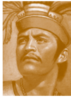
NAVEGANTE CRISTÓBAL COLÓN AHUIZOTL, REY AZTECA (1486-1502)

12 DE OCTUBRE: DÍA DE LA RAZA. 1 El 12 de octubre se conmemora la fecha en que la expedición de Cristóbal Colón llegó a las costas de una isla americana, en 1492. El 12 de octubre se ha considerado como un día memorable porque a partir de entonces se inició el contacto entre Europa y América, que culminó con el llamado "encuentro de dos mundos", que transforma las visiones del mundo y las vidas tanto de europeos como de americanos.