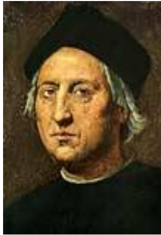
Navegante Cristóbal Colón