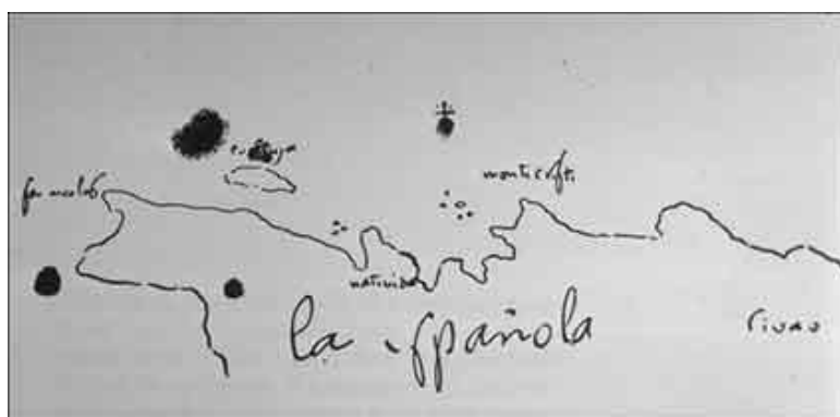
Mapa de La Española

Mientras tanto, en La Española las minas comenzaron a producir oro en abundancia, bajo la supervisión de Bartolomé Colón, hermano del almirante.