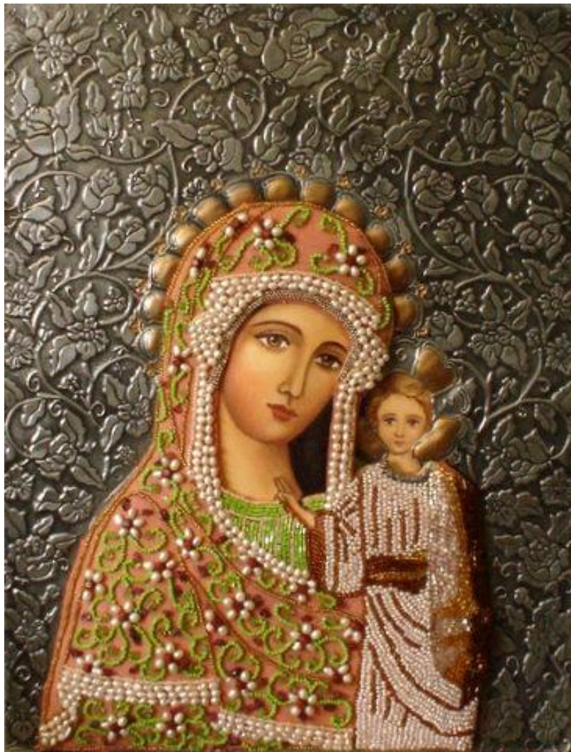
VIRGEN DE KAZAN (Fecha de elaboración 2007-2008)

Un sinnúmero de íconos se han realizado para resaltar a la Madre de Dios, terminaremos con la antifonía que dice: “En Ti nos regocijamos, oh Graciosa y Única, todas las criaturas, el coro de Ángeles y la raza del Hombre, oh razonable Paraíso, oh alabanza de las Vírgenes” (Consagración en la liturgia de San Basilio).