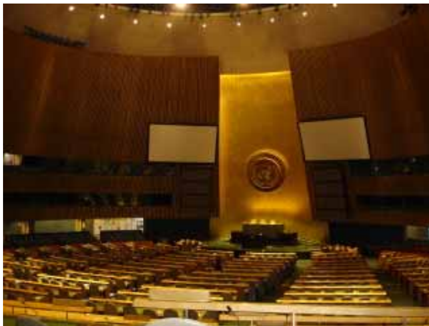
Sala de sesiones de la Asamblea General

Antecedentes.- Desde 1948, se celebra el aniversario de la entrada en vigor de la Carta de las Naciones Unidas, el 24 de octubre de 1945, como Día de las Naciones Unidas. Tradicionalmente, las celebraciones en todo el mundo incluyen reuniones, deliberaciones y exposiciones sobre los objetivos y los logros de la Organización. En 1971, la Asamblea General recomendó que todos los Estados Miembros celebrasen ese día como feriado oficial.