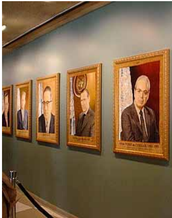
Fotografías de los Secretarios Generales de la ONU (de izq. a derecha): Sr. Trygve Lie (Noruega) -Período a cargo: 1946-1952; Sr. Dag Hammarskjöld (Suecia) -Período a cargo: 1953-1961; Sr. U Thant (Myanmar) -Período a cargo: 1961-1971; Sr. Kurt Waldheim (Austria) -Período a cargo: 1972-1981; Sr. Javier de Pérez de Cuellar (Perú) -Periodo a cargo: 1982-1991.