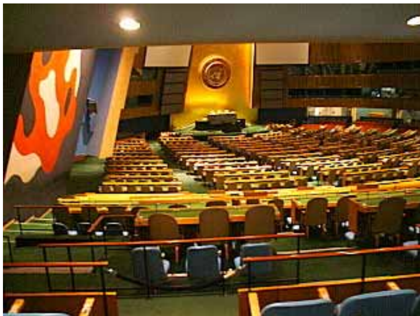
Sala de sesiones de la Asamblea General

Declara que el 24 de octubre Día de las Naciones Unidas, será un día feriado internacional y recomienda que sea celebrado como día feriado oficial de todos los Estados Miembros de las Naciones Unidas. 2000a. sesión plenaria, 6 de diciembre de 1971” 1