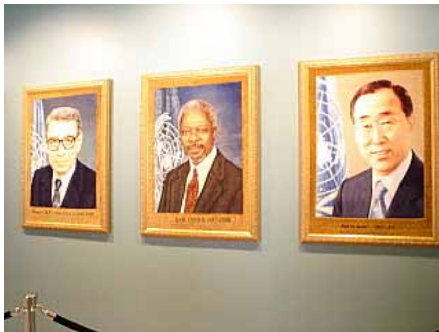
Sr. Boutros Boutros-Ghali (Egipto) -Período a cargo: 1992-1996; Sr. Kofi Annan (Ghana) -Período a cargo: 1997-2006; Sr. Ban Ki-moon -Periodo a cargo a partir del 1° de enero de 2007.