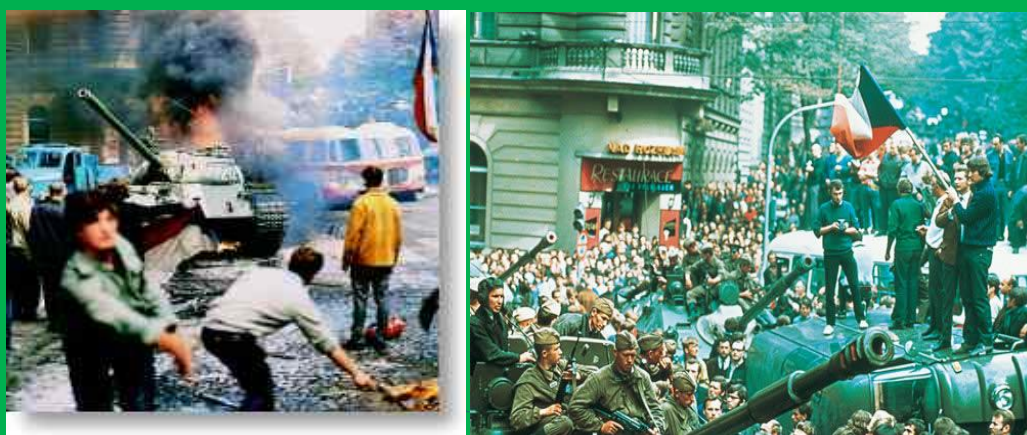
Acciones y manifestaciones en Checoslovaquia

La Primavera de Praga (1968), significó una flexibilización de las medidas comunistas ortodoxas o rígidas, impuestas por los líderes soviéticos, con lo que renace la esperanza de mayores libertades y un ejercicio pleno de soberanía, del pueblo checo y del eslovaco.